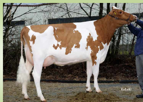
Fanta 05.34629367; V: Serano

*) Selkt+: Bullen mit rein genomischen Zuchtwerten (ohne Töchterinformation)