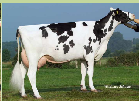
Esche 05.35084371; V: Rumin