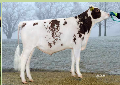
Desk 917337; V: Destry